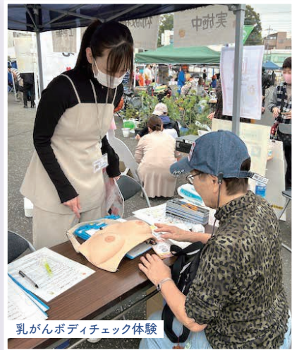
乳がんボディチェック体験

出展参加にあたって、医療生協の医療、介護、暮らしについて皆さまに感じてもらいたいと、なりきりドクター・ナース、握力選手権、乳がんボディチェック体験、すこしお検定クイズを行いました。また、健康づくり体験の一環として、ボランティアさんのご協力でポッチャ体験会も行いました。