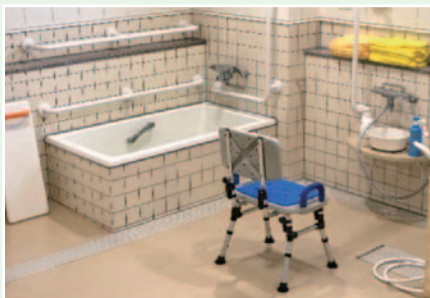
着替え・入浴動作訓練