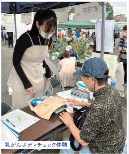
乳がんボディチェック体験

出展参加にあたって、医療生協の医療、介護、暮らしについて皆さまに感じてもらいたいと、なりきりドクター・ナース、握力選手権、乳がんボディチェック体験、すこしお検定クイズを行いました。また、健康づくり体験の一環として、ボランティアさんのご協力でポッチャ体験会も行いました。