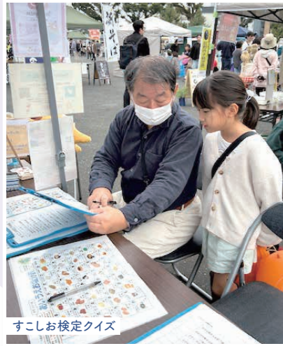
すこしお検定クイズ

出展参加にあたって、医療生協の医療、介護、暮らしについて皆さまに感じてもらいたいと、なりきりドクター・ナース、握力選手権、乳がんボディチェック体験、すこしお検定クイズを行いました。また、健康づくり体験の一環として、ボランティアさんのご協力でポッチャ体験会も行いました。