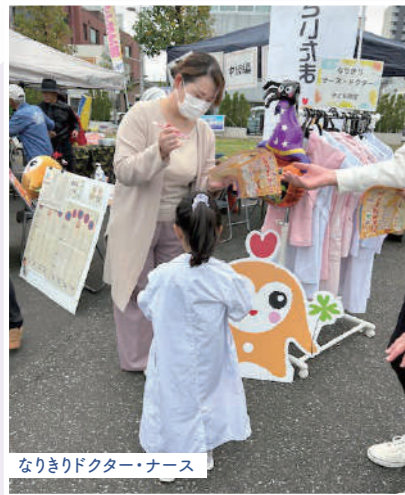
なりきりドクター・ナース

10月26日(土)熊谷市コミュニティひろばで行われた「ニャオざねまつり」に医療生協さいたまがはじめて参加しました。